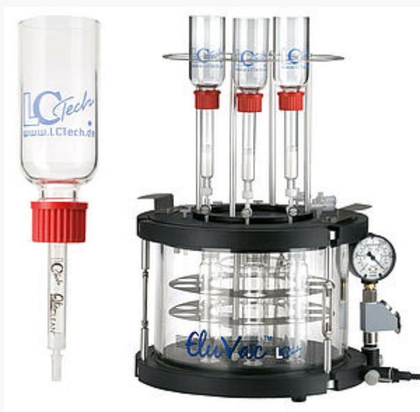
LCTech Vorlagengefäße für große Probenvolumina - hier kombiniert mit einer Immunoaffinitätssäule (links) und mit einer Florisil-Säule auf dem Vakuum Manifold EluVac (rechts).

Aus DURAN-Glas gefertigt sind die Vorlagengefäße spülmaschinenfest und beliebig oft wiederverwendbar. Im Lieferumfang sind Verschraubung und PTFE-Dichtung enthalten.