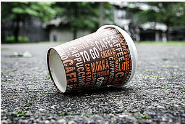
Aus dem Kaffeebecher in die Umwelt

PFAS sind in einer Vielzahl unserer Alltagsgegenstände und -materialien zu finden. Unter anderem werden sie eingesetzt für fett- und wasserabweisende Oberflächen in der Textil- und Papierindustrie, aber auch für Reinigungsmittel, Lacke, Wachse oder Farben. Einen ganz besonderen Einsatzbereich finden PFAS aufgrund ihrer thermischen Stabilität in Feuerlöschschäumen.