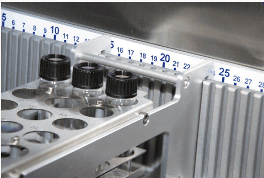
Einfaches Einhängen der Racks in die Kammleiste

Je nach Kombination können bis zu 180 Proben in einer Sequenz abgearbeitet werden.