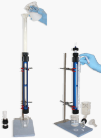
Einfache Wiederbefüllung der Säulen