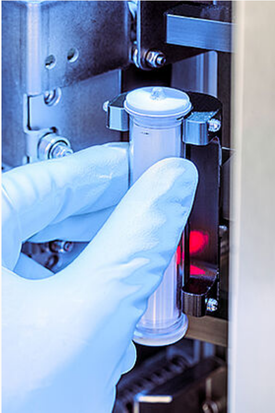
Säulen einsetzen - Start drücken