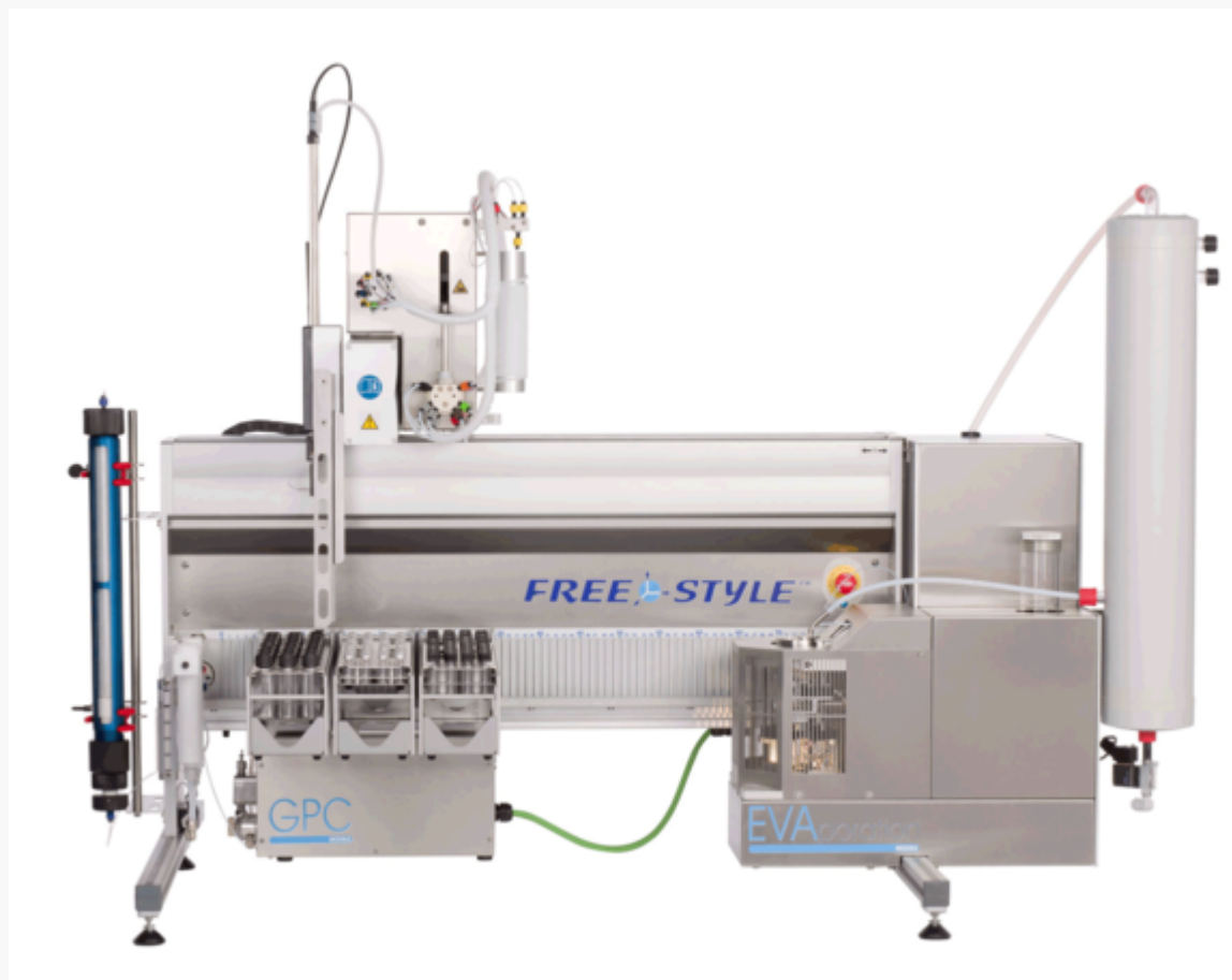
FREESTYLE System ausgestattet für die Probenvorbereitung von Pestiziden mit dem GPC- und EVApurations-Modul sowie einer kleinen Auswahl an Probenracks.

Für diesen Einsatzbereich, insbesondere im Rahmen der revidierten DFG S19 (L 00.00-34), aber auch anderer Analysenmethoden, wie z. B. der AOAC Methoden 984.21, der EN 12393 und der EN 1528, bietet LCTech mit dem FREESTYLE-System und dessen modularem Konzept ein umfassendes Produktspektrum an, das für jeden Anwender den richtigen Automatisierungsgrad bereithält.